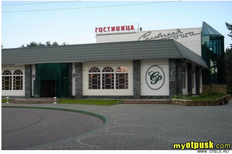
Рисунок 1 – Гостиничный комплекс «Соловьиная роща»